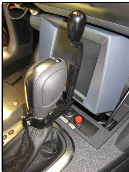
Wählhebellösevorrichtung für Automatikgetriebe

Bei fehlender oder eingeschränkter Fingerfunktion kann mit der Wählhebellösevorrichtung (auch bei verkürzten Armen als Wählhebelverlängerung einsetzbar) ohne großen Kraftaufwand die Sperre des Automatikwählhebels gelöst und ein Gang eingelegt werden.