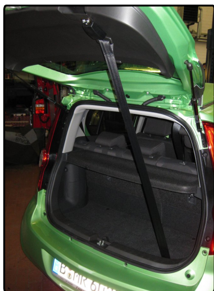
Gurt zum Zuziehen der Heckklappe

Bereitet das Drehen der Zündschlüssel Probleme, ist es möglich die Zündung und das Anlassen des Motors per Knopfdruck zu betätigen.