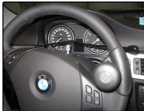
Blinkerhebelumlegung nach rechts als Wippe

Schalter- und Hebelumlegungen sind für Personen gedacht, bei denen eine Hand verkürzt ist oder eine eingeschränkte Funktion aufweist (z.B. keine Fingerfunktion). Je nach Behinderungsart und Fahrzeugtyp sind die abgebildeten Umlegungen in Ausführung und Funktion unterschiedlich. Bei der Blinkerhebelumlegung von links nach rechts und der Wischerhebelumlegung wird ein Aluminium-Klemmstück, welches über die Lenksäule führt, am Originalhebel angebracht. Durch Betätigung des Zusatzhebels auf der einen Seite, wird der Originalhebel auf der anderen Seite bewegt. Die Funktionen des Originalhebels bleiben weiterhin voll erhalten.