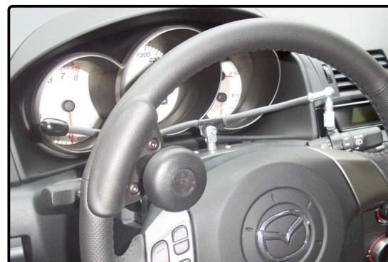
Wischerhebelumlegung nach links als Wippe

Bei fehlender oder eingeschränkter Fingerfunktion kann mit der Wählhebellösevorrichtung (auch bei verkürzten Armen als Wählhebelverlängerung einsetzbar) ohne großen Kraftaufwand die Sperre des Automatikwählhebels gelöst und ein Gang eingelegt werden.