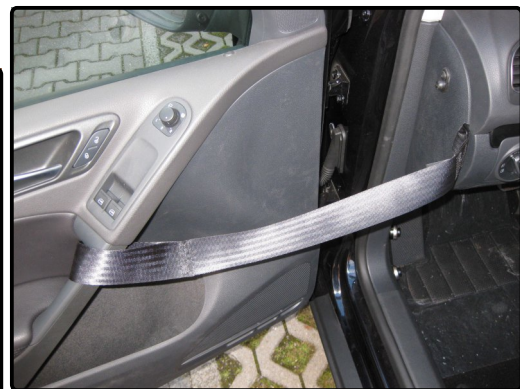
Gurtband zum Zuziehen der Fahrertür